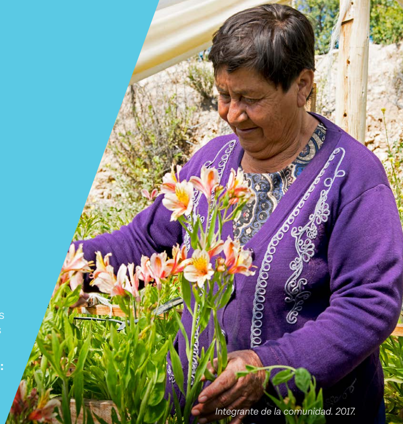
Integrante de la comunidad. 2017.

Información de desempeño de relaciones con las Comunidades: Consulte nuestro Reporte Anual de Sustentabilidad disponible para descargar en nuestro sitio web.