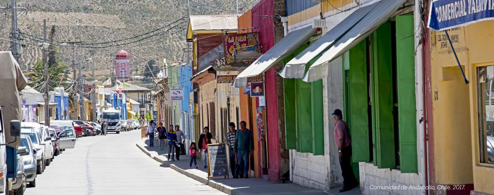
Comunidad de Andacollo, Chile, 2017.

oportunidades de adquisiciones y empleo, inversión y desarrollo de la comunidad y resolución de problemas relacionados con los impactos de la minería.