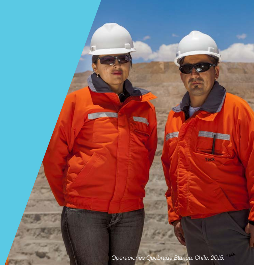
Operaciones Quebrada Blanca, Chile. 2015. Teck

Información de desempeño en Derechos Humanos: Vea nuestro Reporte Anual de Sustentabilidad disponible para descargar en nuestro sitio web.