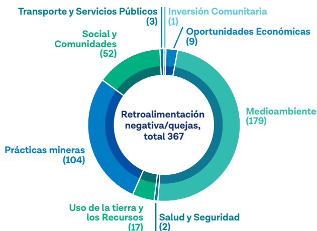
Figura 24: Quejas recibidas por categoría 2021 (1)